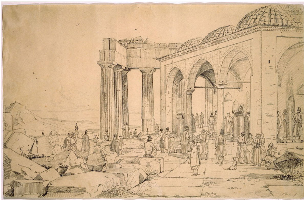
Fig. 2. Martinus Rørbyes tegning fra 1835 viser den ottomanske moske i Parthenon-templet på Athens Akropolis. Nutidens Akropolis er et eksempel på et monument, hvor man har prioriteret hvilken historie, der skulle fortælles. I dag fremstår højen "renset" for minder fra andre perioder. Væk er middelalderlige frankiske forsvarsværker og tårne, en byzantinsk kirke og en ottomansk moske, mens Parthenon er søgt genskabt. Grækerne har gennem årtier ønsket at få udleveret reliefferne fra Parthenon, som befinder sig i British Museum. I begyndelsen påberåbte grækerne sig, at reliefferne var en del af den græske nationalarv. I det seneste årti har man ændret sprogbrug, og taler nu om, at reliefferne er en del af verdensarven og de som sådan burde befinde sig på det sted, hvortil de blev skabt.

Bamiyan-dalen kom i øvrigt på verdensarvslisten i 2003.