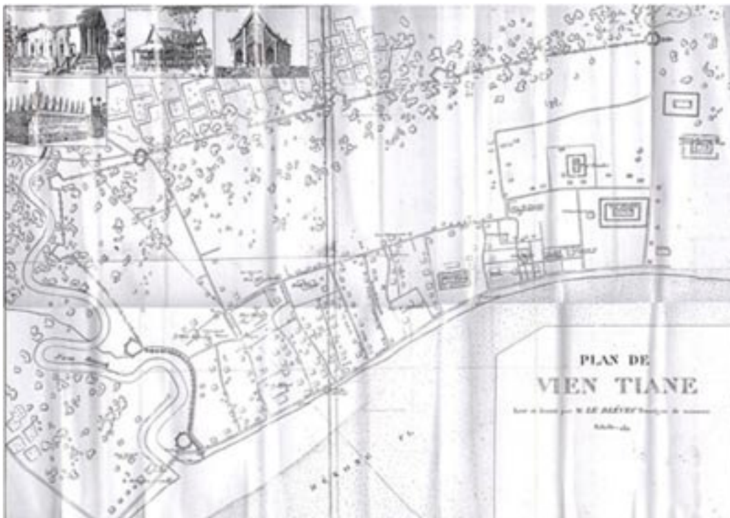
Bild 1. Karta över centrala Vientiane från 1885, så som staden såg ut under kolonialtidens början några år innan Frankrike inkorporerade området i Indokina.