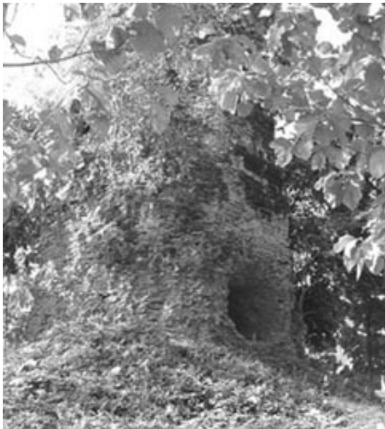
Bild 5. En 500 år gammal stupa i Vientiane som har blivit utsatt för plundring. Olaglig stöld eller del av samtida religionsutövning och kulturarvsbevarande insatser?

“On St Lawrence Island, digging for artefacts is part of every Islander’s heritage, an activity that can usually strengthen one’s connections with the past. Artefacts are regarded as gifts left by the ancestors that, if they allow themselves to be found, are meant for use in today’s world.”