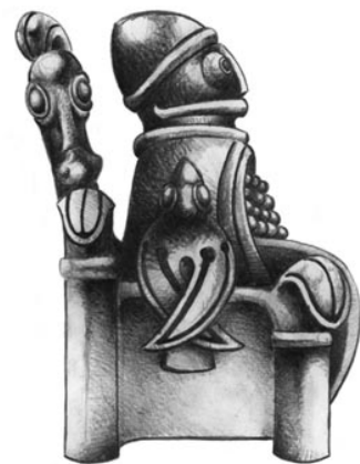
Figuren fra Lejre.