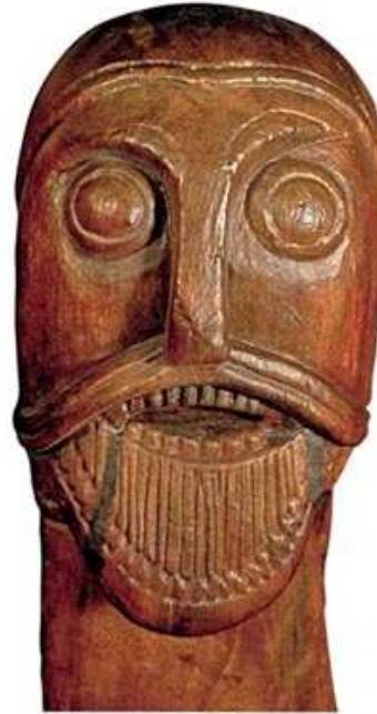
Et af de adskillige mandshoveder fra Oseberggraven. Overskægget er fremstillet som en kraftig dobbeltvulst.

en næse, mens hverken mund eller ører er fremhævet. Lige under næsen ses en horisontal vulst, der strækker sig ud på kinderne, hvor den aftager. Dette tolkes som en markering af et overskæg. Der kendes flere eksempler på lignende overskæg, blandt andet i Oseberggravens træskærerarbejder.