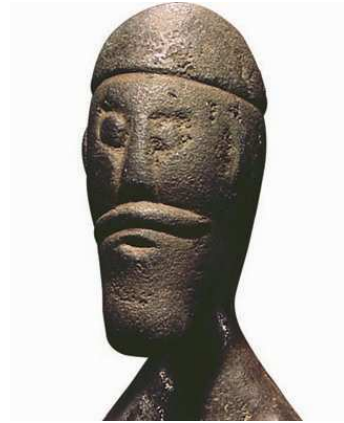
Hovedet på figuren fra Højby ved Odense. Overskæg og hue/hat giver ansigtet karakter.

fund og lader sig vanskeligt datere, men der synes at være enighed om, at det er gudeafbildninger, og at de tidsmæssigt hører hjemme i det 4. til 6. århundrede (Voss 1990:138).