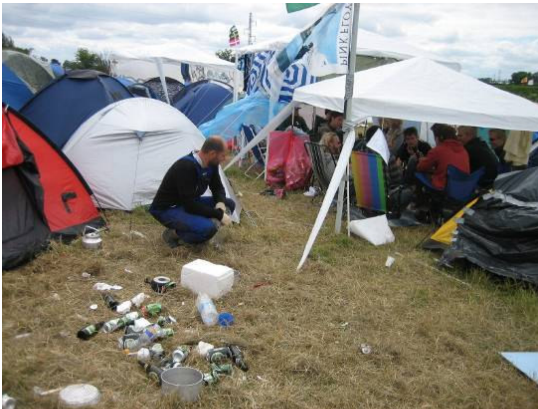
Figur 3: Eksempel på forskellig affaldshåndtering. Billedet er taget, hvor den svenske lejr (intet affald) støder op til en lejr med danske unge (affald).

Der var markante forskelle mellem de danske lejre og den svenske lejr. Mængden af affald var påfaldende lille i den svenske lejr, samtidig med at affaldet blev sorteret i hhv. dåser, glasflasker og andet affald. I de danske lejre var mængden affald generelt større, samtidig med at alt undtagen ølflasker med pant røg ud i samme affaldsbunke/pose. Dette kan tolkes på baggrund af de forskellige traditioner for affaldshåndtering der findes i Danmark og Sverige. Sverige har en temmelig udbygget affaldssortering, som slet ikke findes tilsvarende i Danmark, og som kan forklare den næsten "rituelle" håndtering af affald i den svenske lejr (se fig.3). Denne adfærd kommer til at indvirke på det arkæologiske materiale og kan også aflæses herudfra.