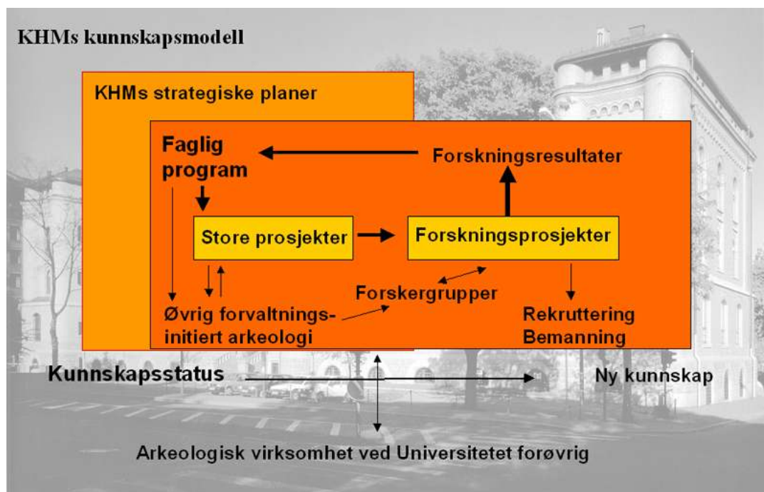
Fig. 2: Kulturhistorisk museums kunnskapsmodell