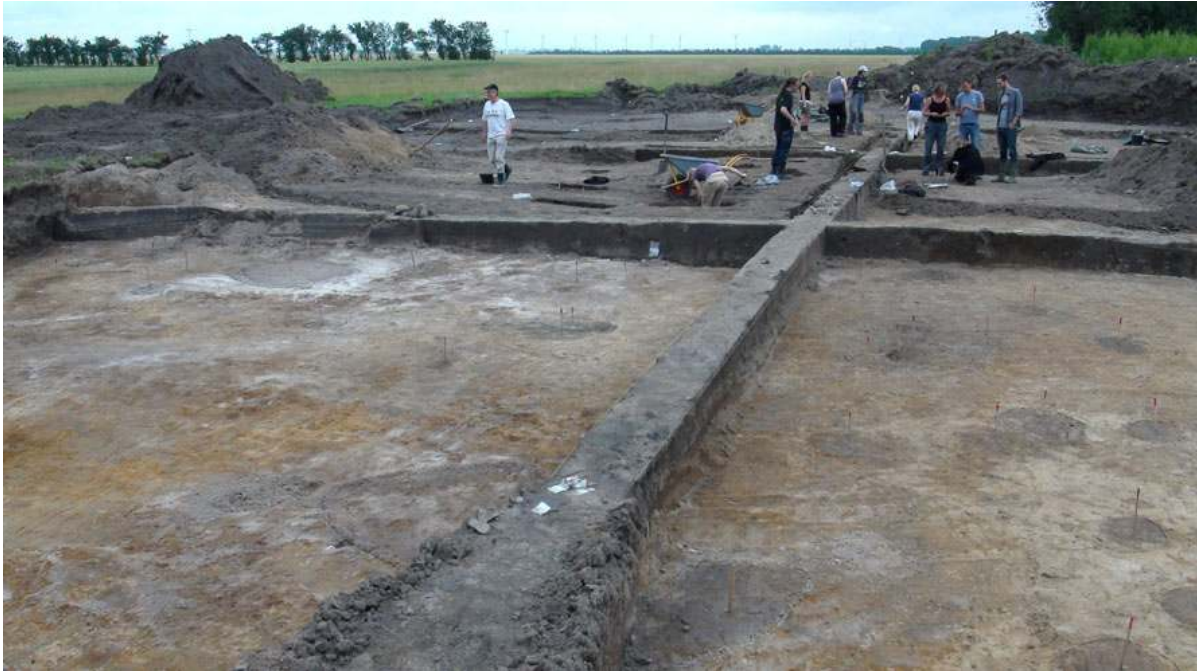
Fig. 4. Et vigtigt element i opkvalificeringen af den arkæologiske udgravningsvirksomhed er uddannelsesudgravningerne for studerende ved Københavns og Århus Universiteter. Her er det seminargravningen af bopladsen fra romersk jernalder ved Hoby under Lolland Falsters Stiftsmuseum og Nationalmuseet .

ekspertstøtte på vanskelige udgravninger, og det skal være ganske naturligt at bede om råd og vejledning.