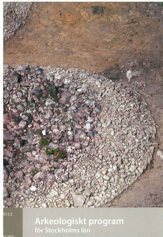
Fig. 3. Sverige har udarbejdet strategi for udgravningsvirksomheden. Her er det rapporten ”Arkeologiskt program för Stockholms län 2012.

Efter megen overvejelse og diskussion er Kulturstyrelsen nået frem til en model, hvor der med hjælp fra faglig ekspertise udarbejdes faglige strategier indenfor arkæologiens kronologiske perioder – dvs. strategier for middelalderarkæologi, ældre stenalder