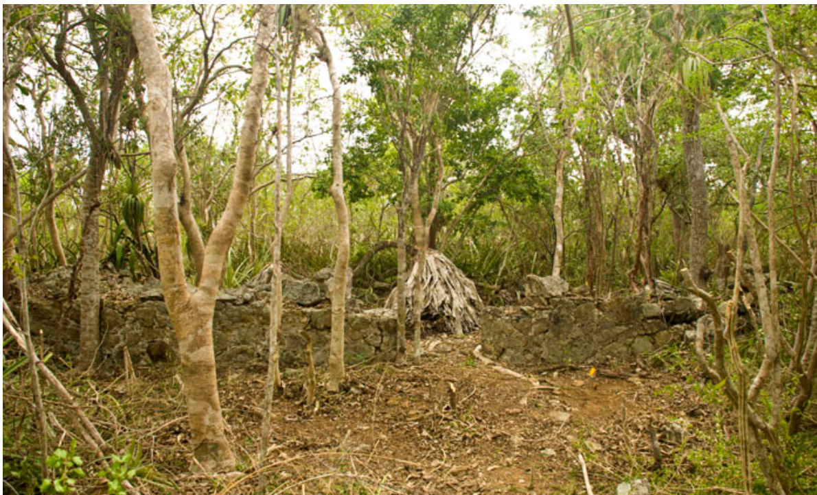
Figur 1. Plantagehus.

antagelser om, at beboerne ikke var blandt de mest velhavende i plantagesamfundet, idet de ikke havde økonomisk overskud til at købe dyrt porcelæn fra Europa, men måtte benytte simpelt og groft lertøj i deres dagligdag på plantagen.