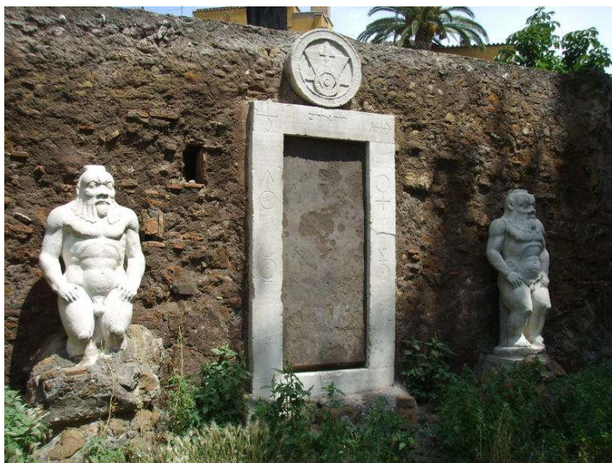
Fig. 3: De to skulpturer af Bes på Piazza Vittorio Emanuele i Rom.

Jeg oplevede for nylig i forbindelse med et symposium med deltagelse af både ægyptologer og klassiske arkæologer, hvordan førstehåndskendskab til det arkæologiske materiale også kan medføre forskellige fagligt begrundede synspunkter i forhold til spørgsmålet om forbindelsen mellem kunstnerisk 'stil' og 'etnicitet'. Diskussionen drejede sig om to – for en klassisk arkæolog – umiddelbart ens udseende skulpturer i hvid marmor af den ægyptiske gud Bes afbilledet som en skægget dværg med tungen hængende ud af munden. Skulpturerne, som i dag er opstillet på Piazza Vittorio Emanuele, er oprindeligt fundet på Quirinalhøjen og fremstillet i Rom i det 2. årh. e.Kr. (Capriotti Vittozzi 1999). På baggrund af den stilistiske udførelse af skulpturerne – specielt skægget – argumenterede ægyptologerne under symposiet for, at den ene af figurerne er 'ægyptisk', dvs. udført af en ægyptisk kunstner, mens den tekniske udførelse af den anden 'ægyptiserende'