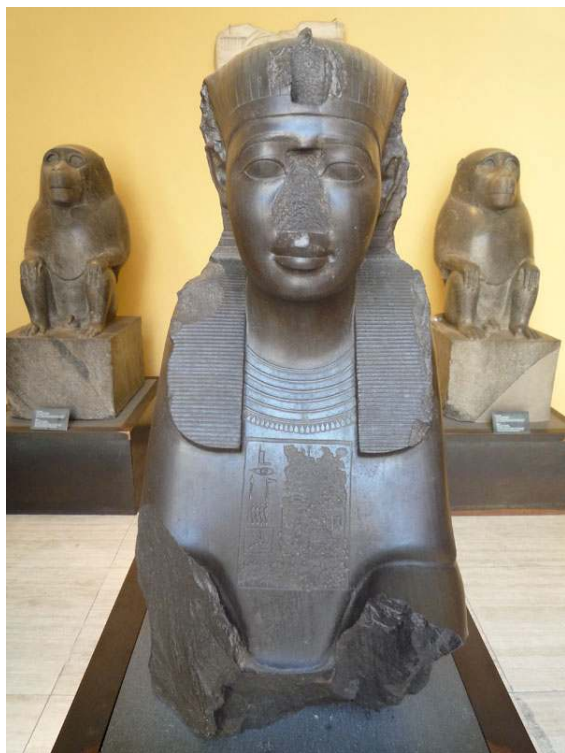
Fig. 2: Faraon Amasis som sfinks (Musei Capitolini 35) og guden Thot i skikkelse af to bavianer (Musei Capitolini 26 & 32) fundet i Via del Beato Angelico i 1883.

Ægyptologernes 'monopol' på studiet af ægyptiske genstande i Rom og Italien har medført en utilsigtet videnskabelig isolation af denne gruppe af genstande, og man forsøger nu i højere grad at få de ægyptiske skulpturer ud af denne 'ghetto' ved også at fortolke dem i forhold til deres romerske kontekster. Dette skyldes primært en øget interesse fra Klassisk Arkæologisk side, men forskningsfeltet tiltrækker også mange ægyptologer, og selvom tilgangen til materialet ofte er forskellig, tror jeg, at netop dialogen mellem fagene er vigtig for at opnå den bedste forståelse af genstandene. I stedet for kun at fokusere på de ægyptiske skulpturer beskæftiger man sig nu med helligdommens samlede skulpturelle udsmykning og overordnede udseende. Der er udover de ægyptiske skulpturer også fundet mange skulpturer i græsk-romersk stil, og studiet af samspillet mellem disse forskellige stilarter og materialer fortæller os noget om, hvordan romerne tilegnede sig og brugte det ægyptiske element i kejsertidens Rom. Derudover ved vi, at det kun var de færreste, der kunne tyde hieroglyffer i Rom. Derfor har det højst sandsynligt ikke været hieroglyffernes ordrette betydning, men derimod samspillet mellem de karakteristiske ægyptiske skrifttegn og skulpturens motiver (sfinkser, bavianer, krokodiller, obelisker), som har betydet noget for det romerske publikum.