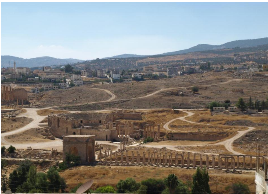
Figur 1. Nordvestkvarteret i Gerasa set fra nordøstlig retning.

Jeg forholder mig i dette indlæg primært til den romerske kejsertid og til et konkret case study: den antikke by Gerasa i Dekapolis-regionen (Fig. 1), som var en del af Romerriget beliggende i det nuværende Jordan (se Raja 2012 for en introduktion til byen og