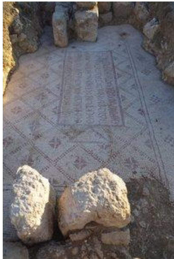
Figur 3. En af indskrifterne i komplekset umiddelbart nord for synagoge-kirken.

Indskrifterne fortæller om rytterenheder fra den justinianske periode, som var udstationeret i Gerasa, og indskrifterne forbinder disse tæt med den kirkelige stand i byen, som ligeledes på det lokale plan var lov-