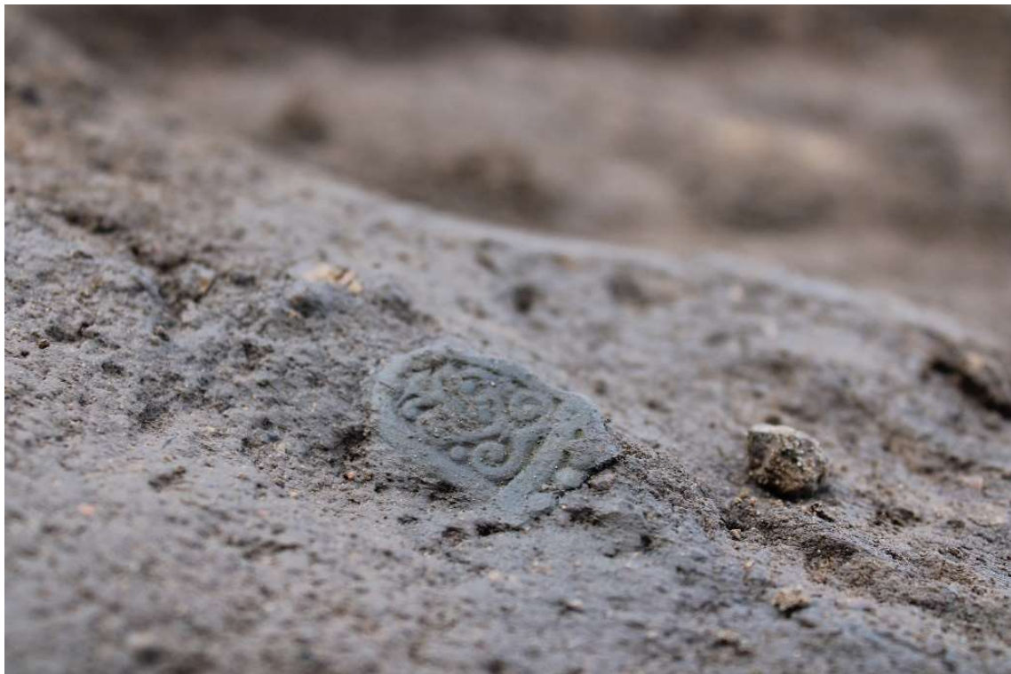
Figur 2: Destrueret genstand. Her et fragment fra en trefliget fibel, liggende i det sekundære offerlag i grav A150 fra Svinningegravpladsen.

Mængden af destruerede genstande, brændte knoglefragmenter og trækul i de sekundære offerlag varierer i gravene. Af det brændte knoglemateriale er der registreret alt fra få gram til over 1,5 kg i gravene fra Svinninge. Denne variation kan enten være et udtryk for forskellige bevaringsgrader på pladsen, eller en bevidst differentiering af fyldmængden.