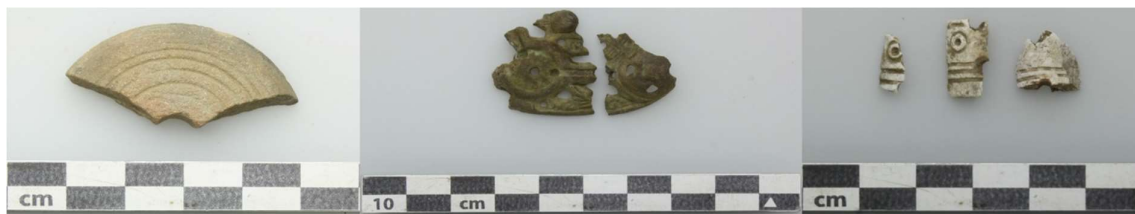
Figur 3: Eksempler på tre typer destruerede genstande fra sekundære offerlag i grave fra Svinninge. Til venstre ses en tenvægt i sandsten (x144) fra A114. I midten ses to fragmenter af en fibel af bronze (x735) fra A123. Til højre ses fragmenter af en ornamenteret benkam (x736) fra A123.

Når man tolker genstande og deres betydning, produktions- og brugstid, ses der ofte på tingenes tilblivelse og biografi (f.eks. Schiffer & Skibo 1997: 35-39). For­skel­lige genstandstyper og materialer får ofte tildelt en særlig værdi eller funktion ud fra for­skel­lige faktorer som f.eks. form, sjældenhed, råma­te­rialet m.m. Et hvert